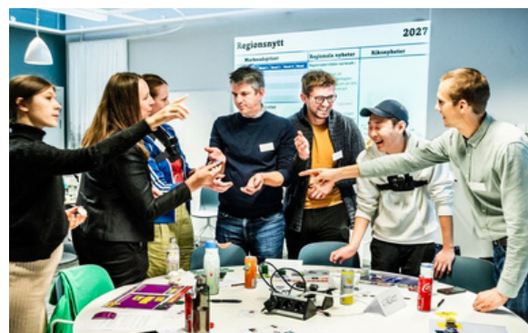
Enodios sökte och beviljades mikrostöd för att utveckla ett megagame, ett spel om hållbarhet för gymnasieskolan.

Under året inkom totalt 19 ansökningar. Av dessa beviljades nio, tre avslogs och fem återtogs av sökande innan beslut fattats. Två ansökningar hade vid årets slut ännu inte varit uppe för beslut. Möjligheten att söka mikrostöd fortsätter under 2026.