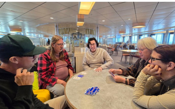
Den nationella leaderträffen 2025 gick av stapeln på Gotland.

Jordbruksverket informerade även om nuläget inför kommande programperiod. Vid tidpunkten för konferensen fanns dock inga fattade beslut, utan informationen avsåg pågående analyser och övergripande inriktning.