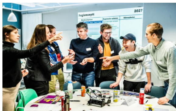
Enodios sökte och beviljades mikrostöd för att utveckla ett megagame, ett spel om hållbarhet för gymnasieskolan.

Under året inkom totalt 19 ansökningar. Av dessa beviljades nio, tre avlogs och fem återtogs av sökande innan beslut fattats. Två ansökningar hade vid årets slut ännu inte varit uppe för beslut. Möjligheten att söka mikrostöd fortsätter under 2026.