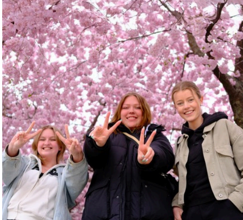
Kommitténs studieresa till Stockholm sammanföll med att körsbärsträden blommade i Kungsträdgården.

Arbetet med rollen som Content Creator har varit en utmaning i projektet. Två personer har anlitats under året men har haft svårt att leverera enligt överenskommelse. Under våren 2026 kommer därför tre nya personer att ta sig an rollen.